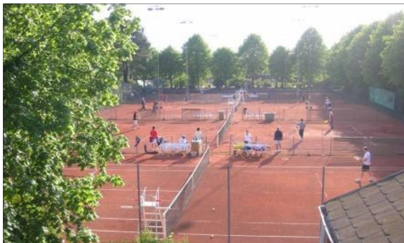
Banerne under onsdagens drop-in. Masser af mennesker der vil prøve tennis. Læs mere på side 3 om succesen.