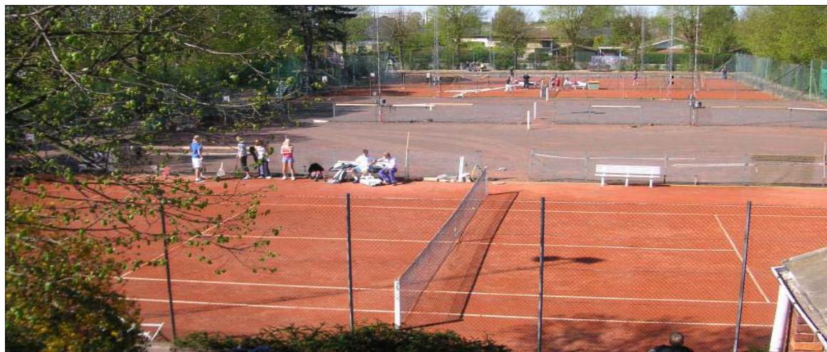
Den håbløse banesituation