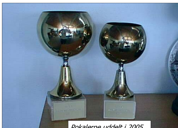
Pokalerne uddelt i 2005