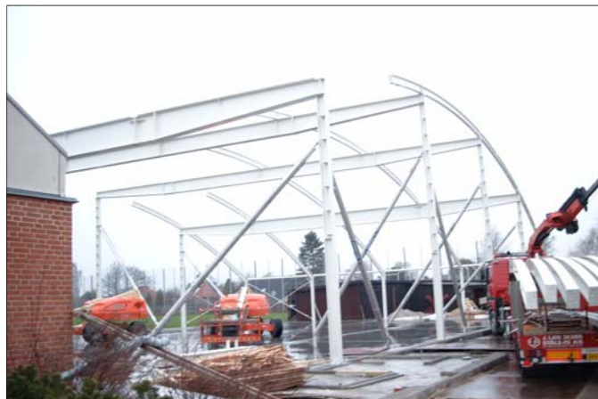
Hallen som den så ud december 2003