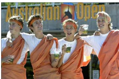
Glade hollændere efter sejren

Det var dog måden han tabte på der var virkelig pinlig. Lige meget hvad der skete, så var det ikke Kenneths fejl. Først var det vinden, herefter fluerne, hvorefter han så sig ond på linjevogterne og til sidst dommeren. Det er utrolig hvordan en 30årig voksen mand, kan blive så utålelig pivet fordi at spillet ikke lige går hans vej. Jeg har fået et par fremragende billeder af vor danske stolthed der er i gang med at samle ketsjeren op efter endnu en gang at have kastet den i raseri og et af ham